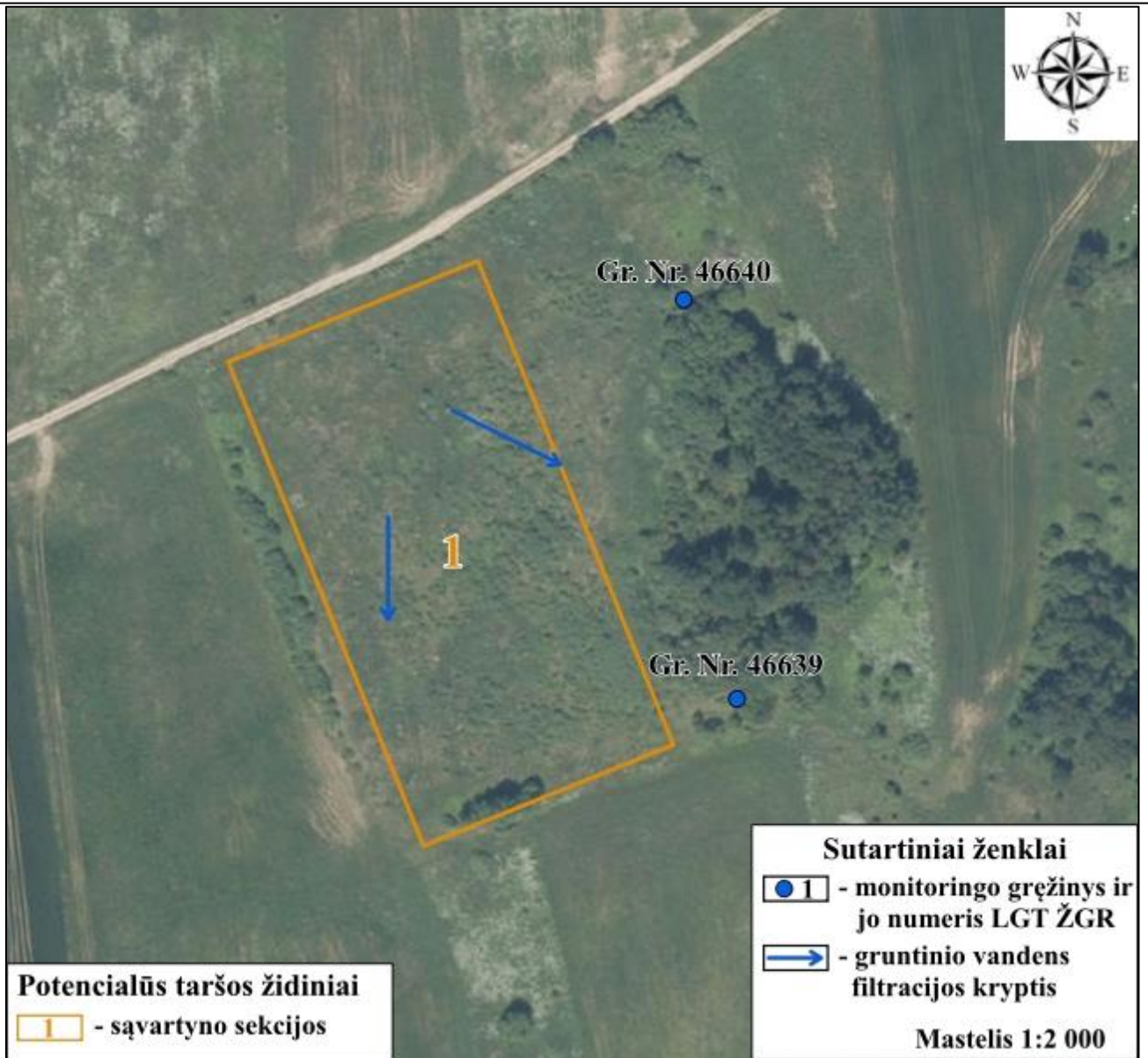
8.1 pav. Sąvartyno teritorijos monitoringo tinklo schema